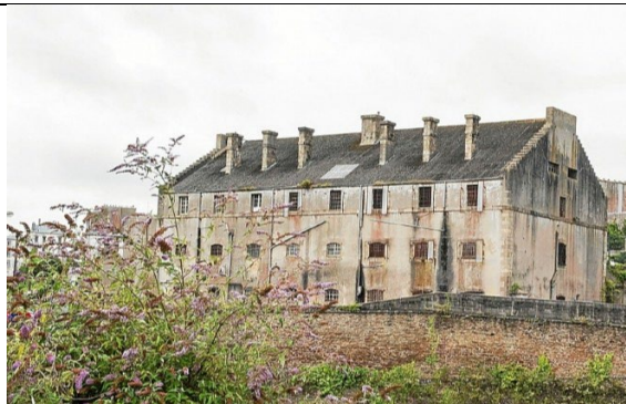
Prison de Pontaniou à Brest